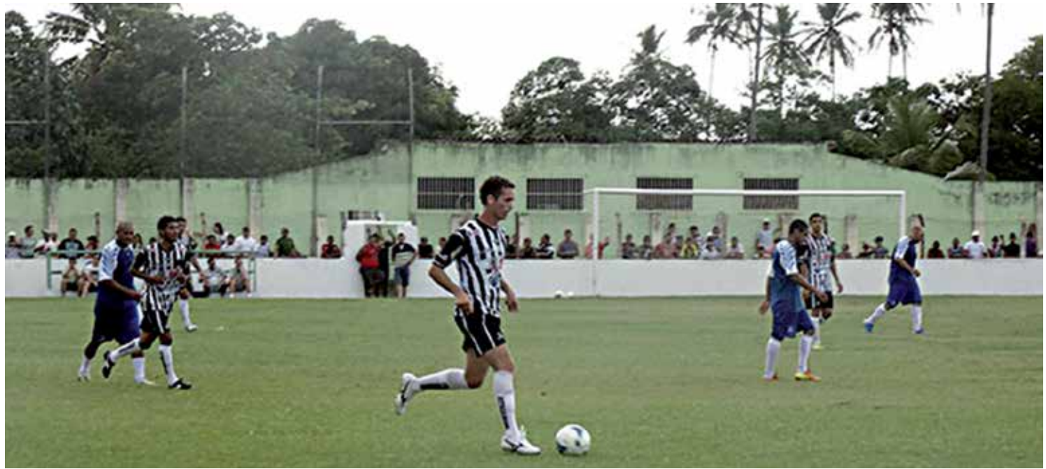
O time principal do Botafogo-PB foi a Pilar e venceu selecionado local por 7 a 1, dentro da programação de preparação para o Paraibano

Quando o assunto é a melhor defesa, Campinense e Sousa estão empatados na liderança. Os dois clubes levaram apenas 8 gols cada. Já a pior defesa é do lanterna Sport Campina, que já tomou 40 gols.