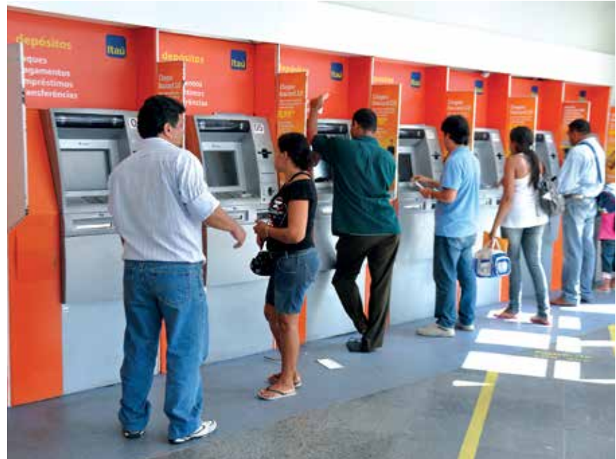
PB tem 47 cidades sem agência bancária PÁGINA 10