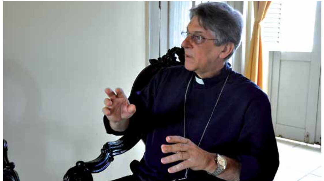
O arcebispo Dom Aldo Pagotto vai celebrar a missa no lançamento da Campanha da Fraternidade

Esclarece ainda que o tráfico de pessoas pode ocorrer sob a forma de exploração da prostituição de outra pessoa ou outras formas de exploração sexual, de trabalho ou serviços forçados, de escravatura ou práticas similares à escravatura, de servidão ou de remoção de órgãos, nos termos da Convenção de Palermo.