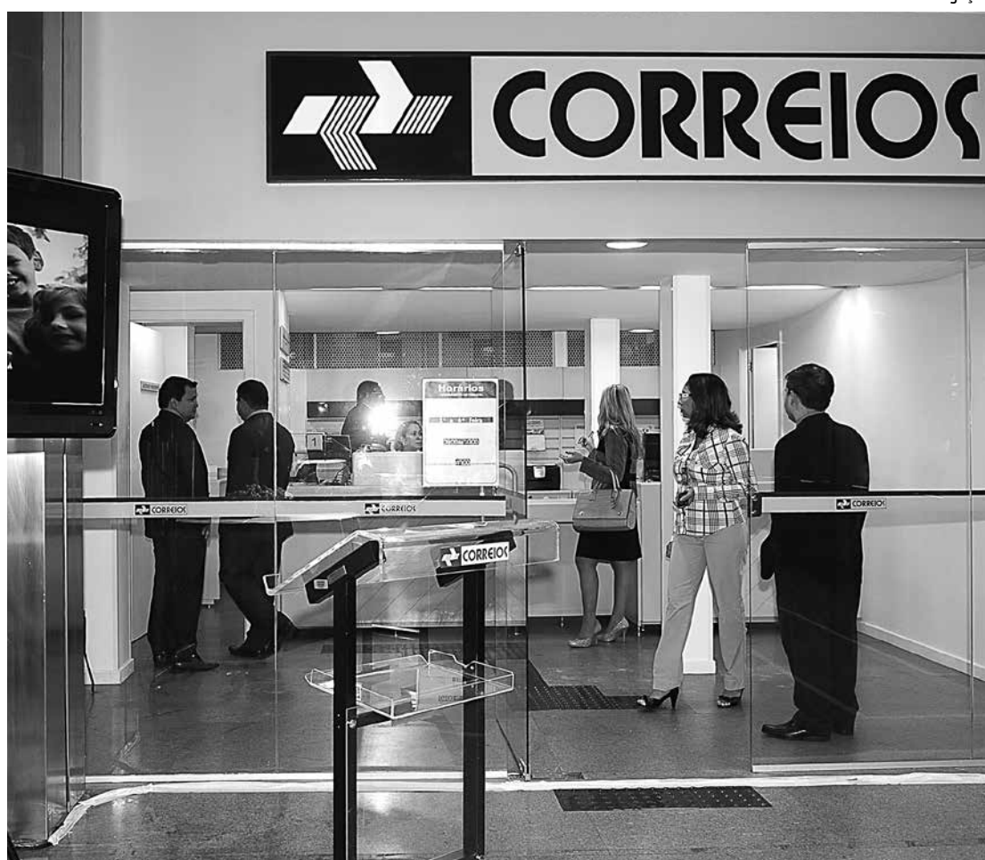
Correios oferece Banco Postal que vem suprimindo a falta de serviços bancários em alguns municípios

Na cidade de São João do Arraial, a 253 km de Teresina, Estado do Piauí, foi criado um banco local para contornar a falta de serviços bancários. Criado em dezem-