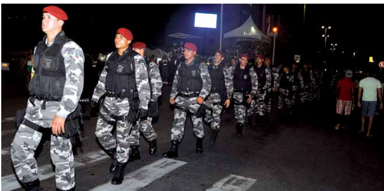
Efetivo de policiais civis e militares chega a 1.800 neste Carnaval e bombeiros somam 500, em João Pessoa

No período da última quinta-feira até à noite do domingo, cinco armas foram apreendidas durante rondas nos bairros do Cristo, Mangabeira, Cruz das Armas, Tambaúzinho e Centro. No total, 13 pessoas foram presas e apreendidas sob suspeitas de crimes.